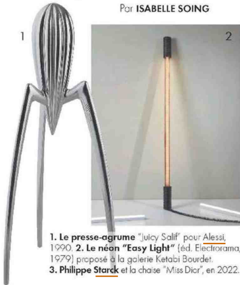
1. Le presse-agrumes "Juicy Salif" pour Alessi, 1990. 2. Le néon "Easy Light" (éd. Electrorama, 1979) proposé à la galerie Ketabi Bourdet. 3. Philippe Starck et la chaise "Miss Dior", en 2022.