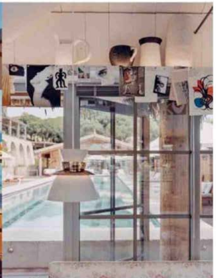
Un spa de 2000 mètres carrés.