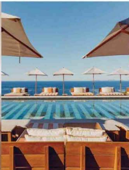
Un lieu consacré au bien-être.