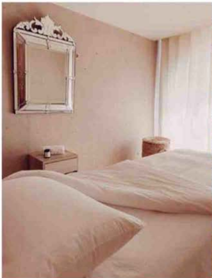
38 chambres et 6 suites.