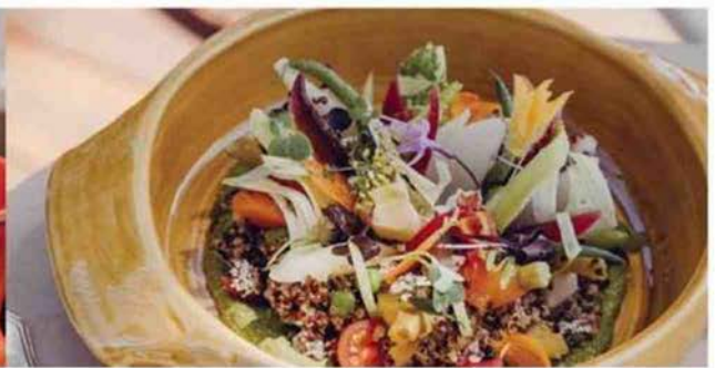
Cuisine raffinée et healthy.