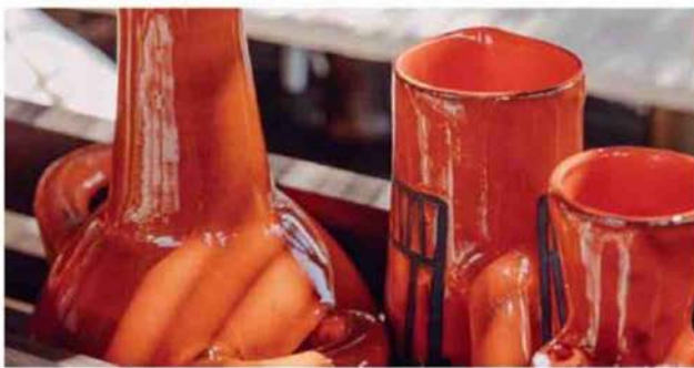
Céramiques de Vallauris et faïences de Biot.